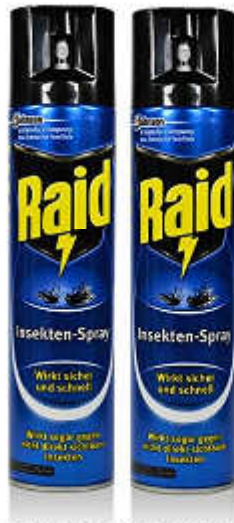
Für größere Ansicht Maus über das Bild ziehen